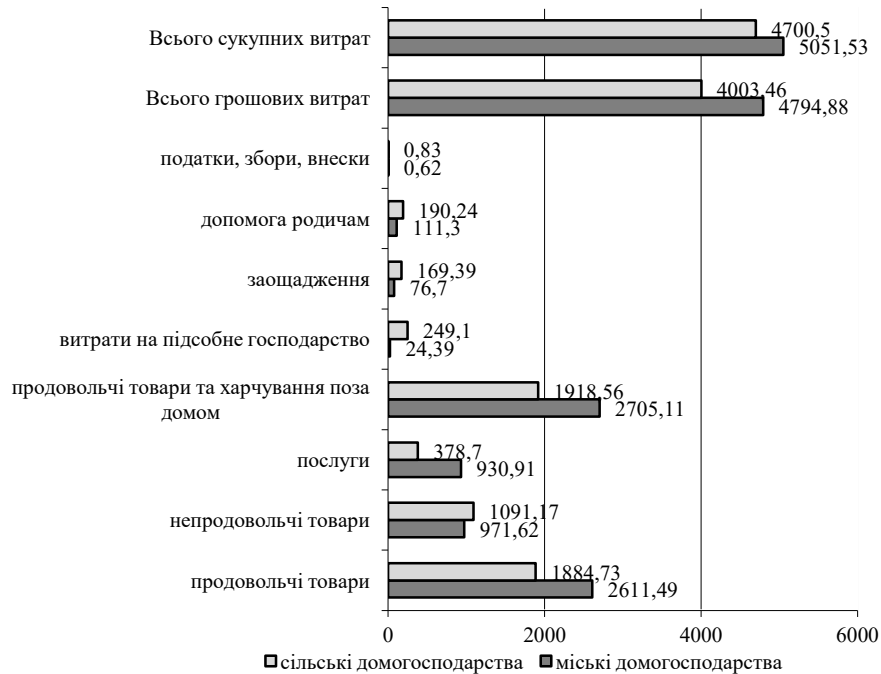
Рисунок 2 – Витрати домогосподарств у сільській та міській місцевостях у третьому кварталі 2015 р., грн (побудовано за [1])

Як свідчать дані рис. 1, сільські домогосподарства отримують меншу суму доходів від найманої праці, водночас маючи більші суми доходів від власності та продажу продукції власного виробництва; є менш залежними від допомоги родичів; отримують більшу, порівняно з міськими, суму соціальних трансфертів. Рівень доходу на одне господарство є більшим, ніж у міських поселеннях. З урахуванням більшої чисельності осіб-членів домогосподарства (у середньому 2,17 осіб проти 2,08 осіб у міських), середньодушовий дохід сільського мешканця є меншим від аналогічного у міського (майже на 150 грн), не досягаючи визначеного за самооцінкою розміру, достатнього, щоб не відчувати себе бідним. Необхідно звернути увагу на те, що сума доходів сільського домогосподарства, отримана від продажу продукції, більше ніж у 2,5 рази перевищує дохід від підприємницької діяльності міських жителів, хоча при цьому ці доходи не визнаються підприємницькими.