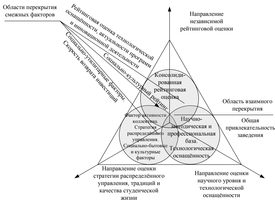
Рисунок 1 – Упрощённая идеализированная модель оценки бренда высшего учебного заведения

Будем считать деятельность оптимальной, если данные три направления являются сбалансированными. То есть каждое из направлений должно быть развито настолько, чтобы обеспечивать свою роль и поддержать (не тормозить) другую деятельность в достижении общих целей – подготовке компетентных конкурентоспособных специалистов. Представим искомую модель в форме треугольника баланса, в который вписана модифицированная диаграмма Эйлера. Три круга этой диаграммы отображают три основных фактора, выбранных для оценки. Графическое изображение упрощённой идеализированной модели оценки с соответствующими комментариями представлено на рис. 1.