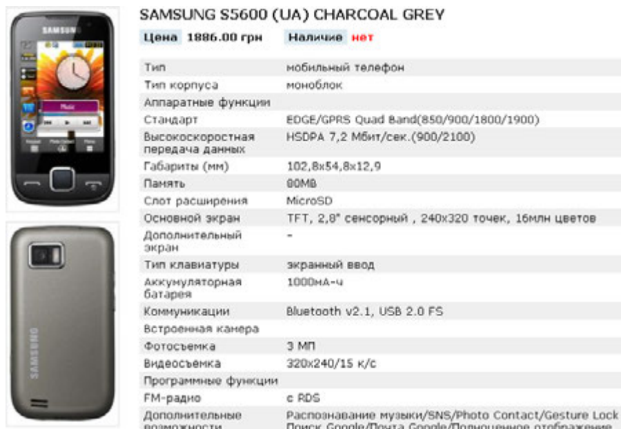
Рисунок 3 – Вивід основних характеристик продукту за базовими категоріями

у списку, але відсутній на складі, то можливе його завезення. У разі ж, якщо завезення товару найближчим часом не очікується, то він видаляється зі списку.